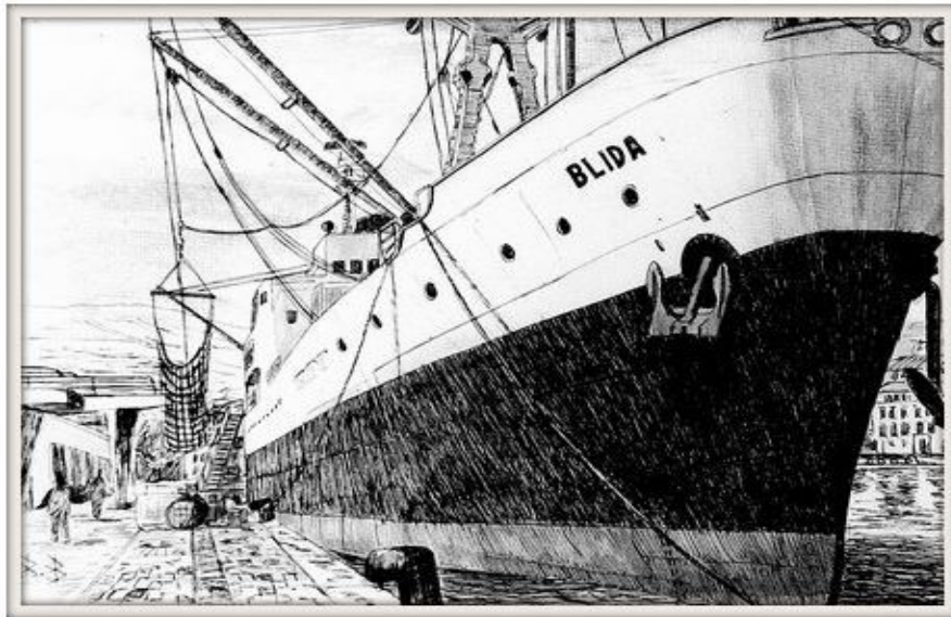
Cargo BLIDA en cours de déchargement.

https://bernardbernadac.monsite-orange.fr/page-5665c7aeb7a56.html