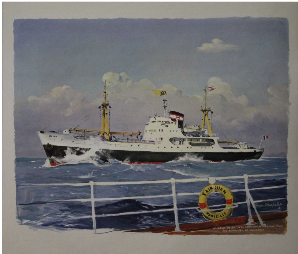
Cargo BLIDA – Cie de Navigation Mixte – Affiche originale entoilée Roger Chapelet

https://bernardbernadac.monsite-orange.fr/page-5665c7aeb7a56.html